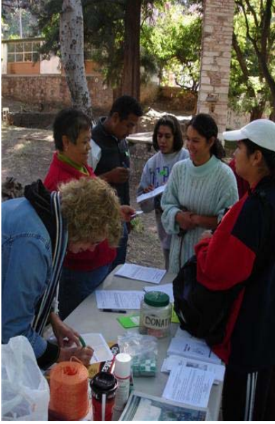
Registrando sus mascotas