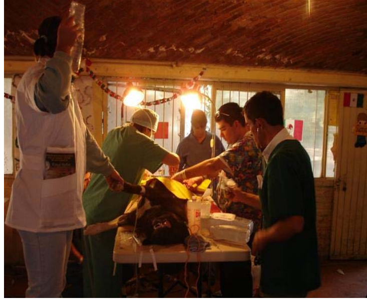
Operando a Cookies