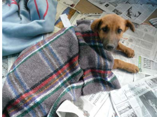
Una cachorra se despierta en la unidad de recuperación