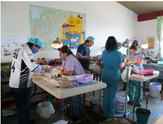
Arriba: Algunos de los cirujanos y técnicos que trabajaron durante la campaña de noviembre en el Cerro de Cuarto

El fin de semana del 8 y 9 de noviembre en la ciudad de Guanajuato, nuestro equipo de voluntarios incluyó cuatros veterinarios y cinco técnicos veterinarios de Nueva York, que vinieron a la ciudad por su propia cuenta y gastos trayendo también materiales quirúrgicos. La campaña se llevó a cabo en el área del Cerro del Cuarto donde cuatro aulas de un kinder fueron convertidas en hospital temporáneo con salas de anestesia, cirugía y recuperación. Otros voluntarios que participaron fueron veterinarios, médicos, técnicos veterinarios, enfermeras y ayudantes de las ciudades de Guanajuato, San Miguel de Allende y Silao. El equipo esterilizó 96 animales—44 perras, 11 perros, 29 gatas y 12 gatos. Los pacientes más pequeños tenían 2 meses.